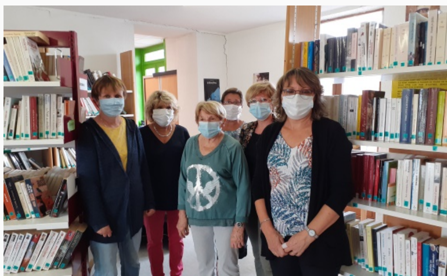
Une partie des bénévoles qui assurent le bon fonctionnement de la bibliothèque

En cette rentrée 2020, la bibliothèque municipale de Bas en Basset vous accueille la semaine du mardi au samedi. Les permanences sont assurées uniquement par une équipe de bénévoles qui s'organisent pour faire vivre et développer le service de lecture publique.