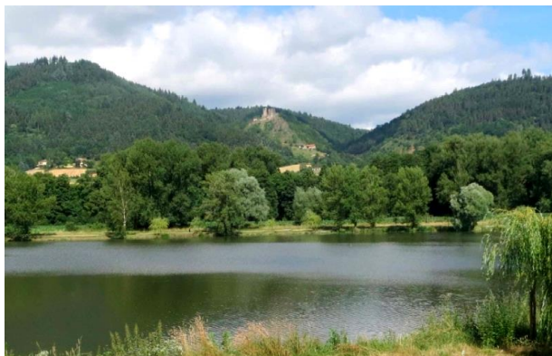
Vue sur le château de Rochebaron