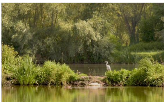
Héron bihoreau dans le biotope

- Le CIPIE du Velay , pour la constitution d'une bibliothèque numérique permettant l'intégration des données sur les supports numériques, en partenariat avec la LPO Auvergne .